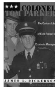
Colonel Tom Parker