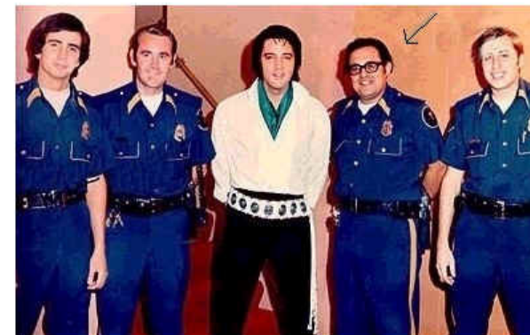
Elvis ao lado dos policiais de Las Vegas em 1971

Os guardas ficavam a borda do palco para proteger Elvis. Elvis se aproveitava da situação pegava emprestado o quepe de algum e brincava com o público! (foto de 1976)